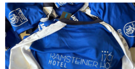
Neue Shirts für die C-Junioren vom „Ramsteiner Hof“