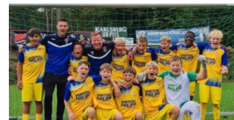
Die D1 sorgt in der Landesliga weiter für Furore!