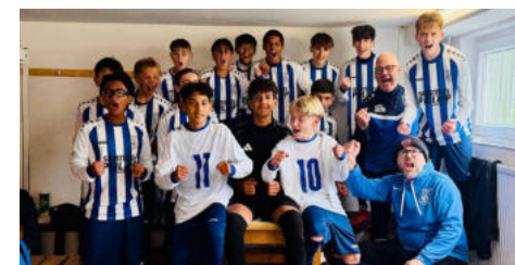
C1 gewinnt die Quali ohne Punktverlust und hat beide Spiele in der Hauptrunde gewonnen