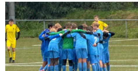
C2 mit einem klaren 8:0 Sieg gegen den SSC Landstuhl

Auch die D-Junioren sorgen in diesem Jahr wieder in der Landesliga für Furore und eilen von Sieg zu Sieg!