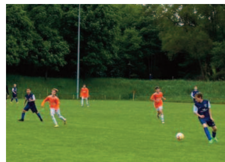
D-Junioren Kreisliga Westpfalz Mitte 2022/23