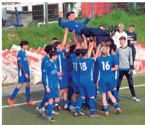
B-Junioren Kreisliga Westpfalz Mitte 2022/23