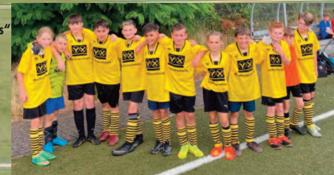
Sind alle Olympianer(fast). Vielleicht noch 1-3 von Kottweiler!