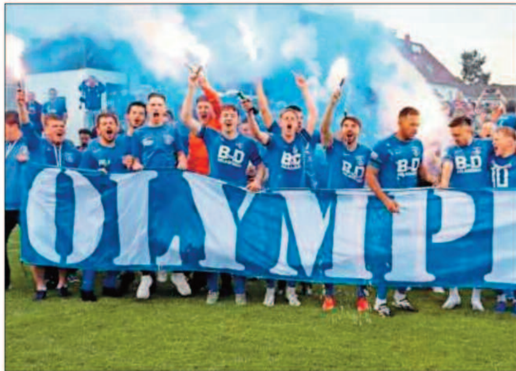
Nach dem Sieg über Wolfstein/Roßbach feiern die Spieler des FV Ramstein die Meisterschaft.

Auch in der Meisterschaftsrunde lief es wie am Schnürchen: In den ersten 18 Spielen ging Ramstein trotz krankheits- und verletzungsbedingter Ausfälle 17 mal als Sieger vom Platz, lediglich ein Unentschieden „trübte“ die Bilanz. Dass der 16-Punkte-Vorsprung aus der Hauptrunde im Winter durch die Zusammenlegung der beiden Gruppen dahinschmolz, ist der besonderen Arithmetik der Aufstiegsrunde zu verdanken. Die